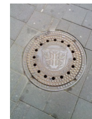
DIN EN 124