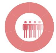
Veröffentlichung der Norm