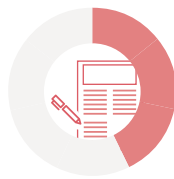
Manuskript für Norm-Entwurf