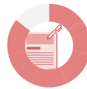
Manuskript für Norm